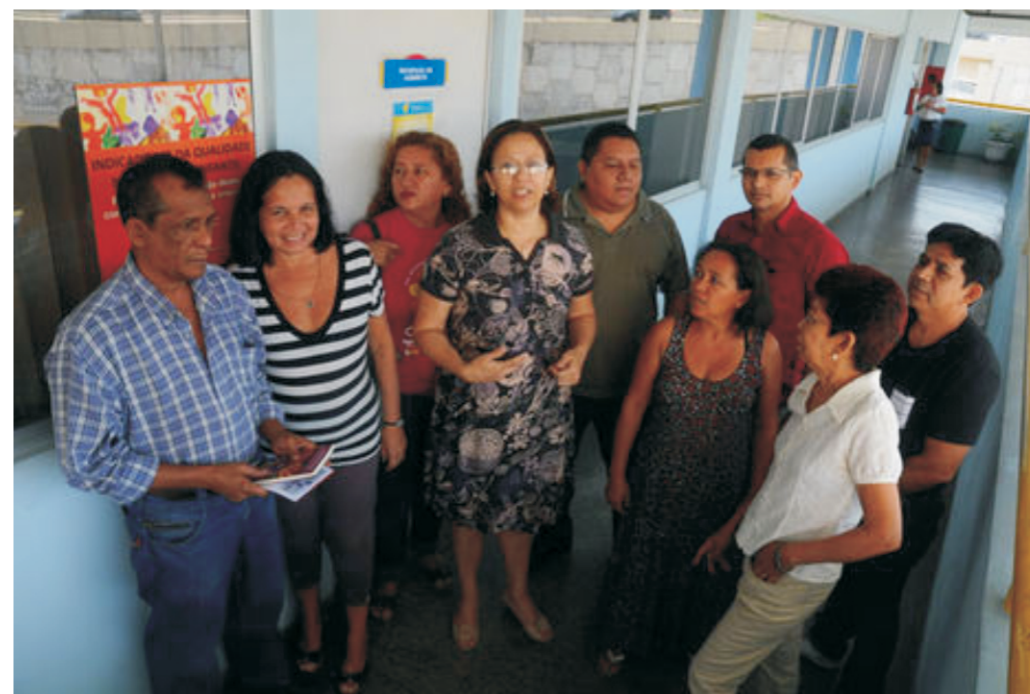
Diretoria do SINTEAM acampou na porta da SEMED e cobrou do secretário transparência no processo

PORTAL EM TEMPO publicou no dia 09 de setembro.