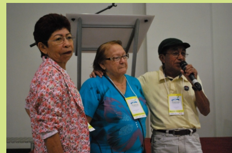
9º Congresso Estadual do SINTEAM