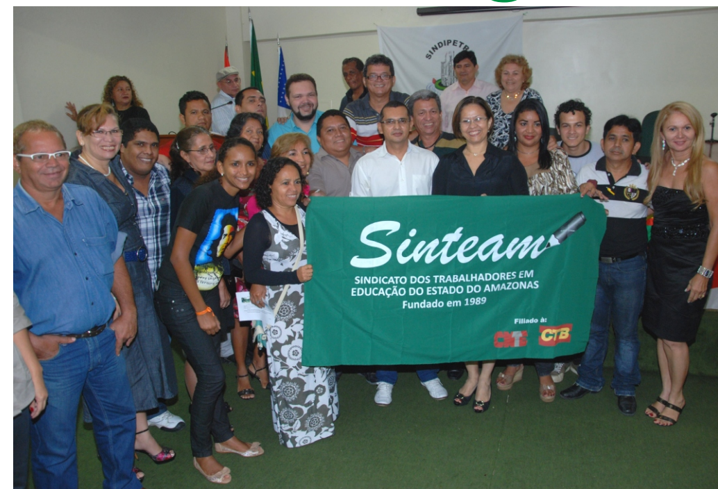
Diretoria do SINTEAM toma posse e assume compromisso de atuar em prol dos trabalhadores em educação

Mais de 10 mil pessoas participaram, em outubro, da 5ª Marcha Nacional em Defesa e Promoção da Educação Pública promovida pela Confederação Nacional dos Trabalhadores.