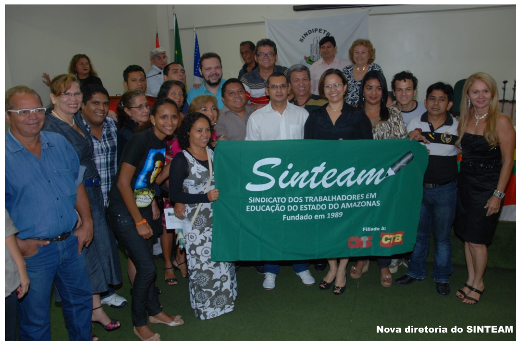
Nova diretoria do SINTEAM

Em discurso o deputado Sinésio Campos destacou a atuação exemplar do SINTEAM em defesa das bandeiras de luta pela valorização do trabalhador em educação. "O SINTEAM é um sindicato transparente, atuante e participativo. Ninguém pode negar que sua conduta foi ética e exemplar e que ele vem cumprindo seu papel enquanto representante dos trabalhadores em educação", destacou. Elson Melo reforçou que a atuação do SINTEAM foi refletida nas eleições. A votação este ano, segundo ele,