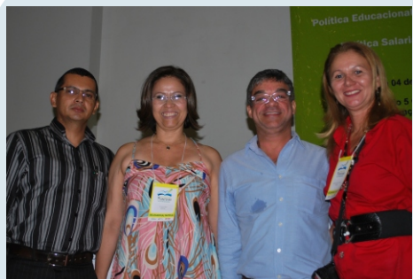
9º Congresso Estadual do SINTEAM