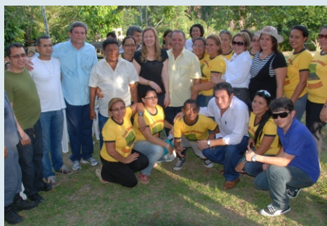
Autoridades participam da inauguração do CREL