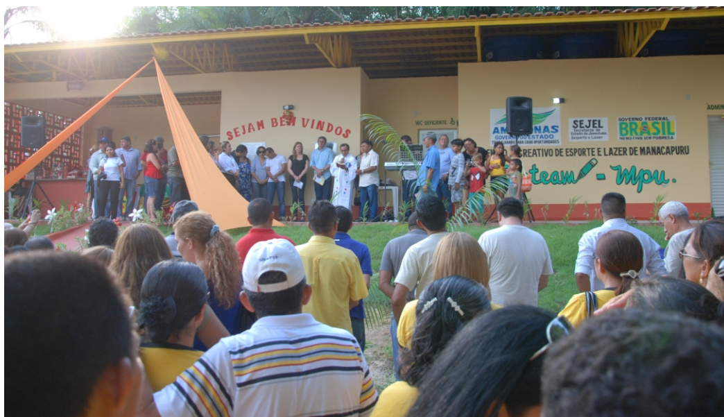
Centro Recreativo de Esporte e Lazer é uma conquista dos trabalhadores em educação

O primeiro Centro Recreativo de Esporte e Lazer (CREL), construído após uma demanda dos professores através do SINTEAM foi inaugurado e entregue aos trabalhadores em educação em dezembro do ano passado. Esse é o primeiro de uma série de 16 centros que estão sendo construídos no interior. Além de Manacapuru, as cidades de Tefé, Humaitá, Caruaru, Lábrea, Maués, Uruará, Codajás, Nova Olinda do Norte, Barcelos, Tabatinga, Parintins, Itapiranga, Eirunepé, Beruri e Manaus serão contempladas. Os recursos para a construção das sedes foram obtidos através de emenda parlamentar, em 2008, pela