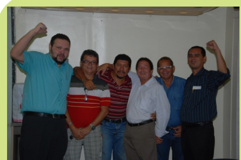
Posse da nova diretoria do SINTEAM