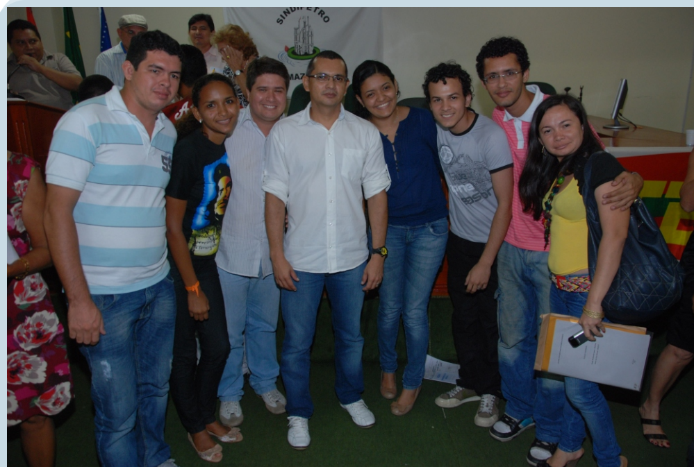
Movimento estudantil prestigia posse da nova diretoria do SINTEAM