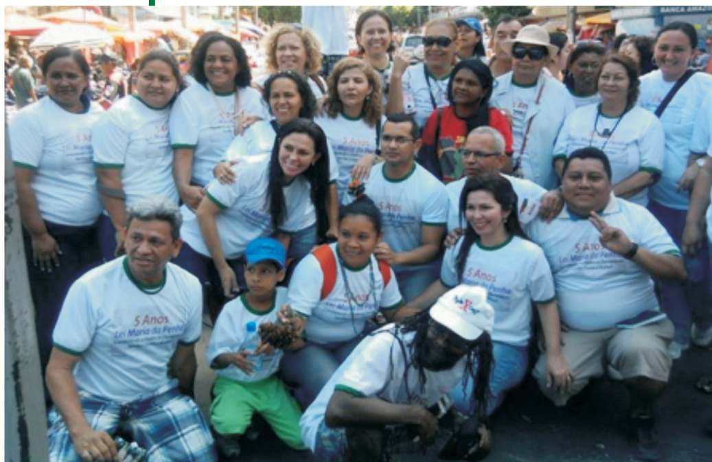
Professores vestiram a camisa e foram às ruas pedir o fim da violência contra a mulher no AM

Representantes do SINTEAM participaram em agosto do ATO em comemoração aos cinco anos da Lei Maria da Penha. A Lei foi sancionada em agosto de 2006 pelo então presidente Lula. O ATO foi organizado pelo Conselho Estadual dos Direitos da Mulher (CEDIM) e contou ainda com a participação de representantes da União Brasileira de Mulheres (UBM), Central dos Trabalhadores e Trabalhadoras do Brasil (CTB), Secretaria de Estado da Justiça (Sejus), Secretaria de Estado de Assistência Social (Seas), dos Movimentos Negro e Indígena e da população em geral.