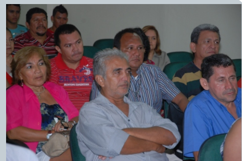
Associados prestigiam posse da Diretoria