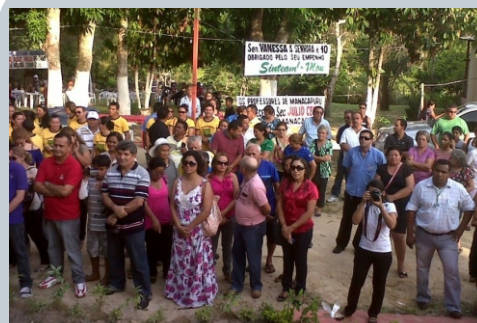
Categoria comemora criação do CREL