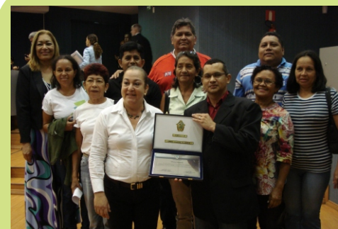
Professores são homenageados na CMM